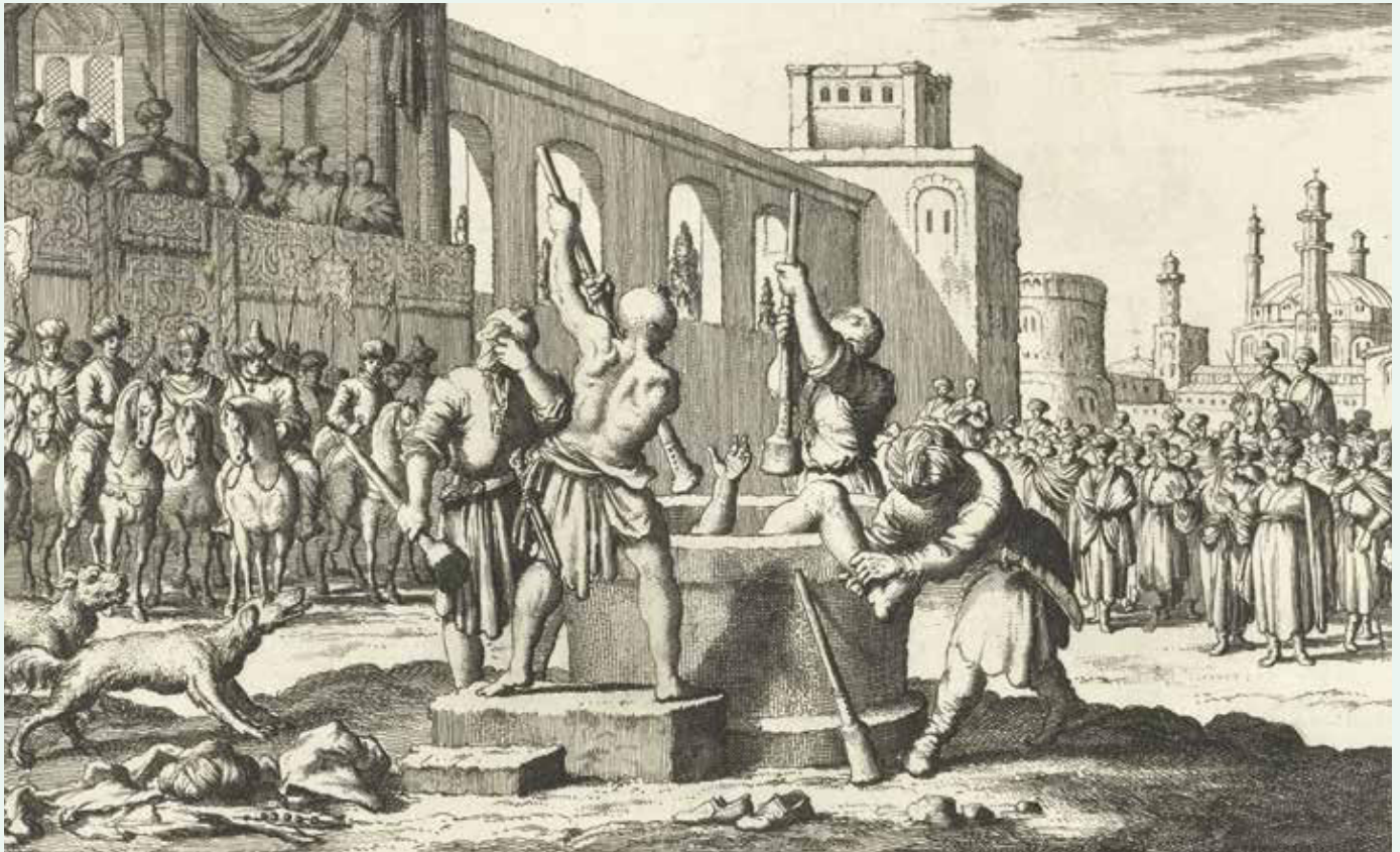
Jan Luyken, Een veroordeelde wordt door vier beulen doodgestampt, 1682 Rijksmuseum Amsterdam

extra opstrijken voor het afslaan en het op een pin zetten van het hoofd. Indien de veroordeelde moest worden opgehangen aan de galg, mocht de beul een gulden en tien stuivers in rekening brengen voor het touw, en zes guldens voor het lossnijden, op een kar leggen en op het galgenveld tentoonstellen van het lichaam. Voor het ten uitvoer leggen van lijfstraffen, zoals het afsnijden van een oor, het doorboren van de tong, het uitsteken van een oog of het afslaan van een hand, kon hij drie guldens aan extra kosten declareren.