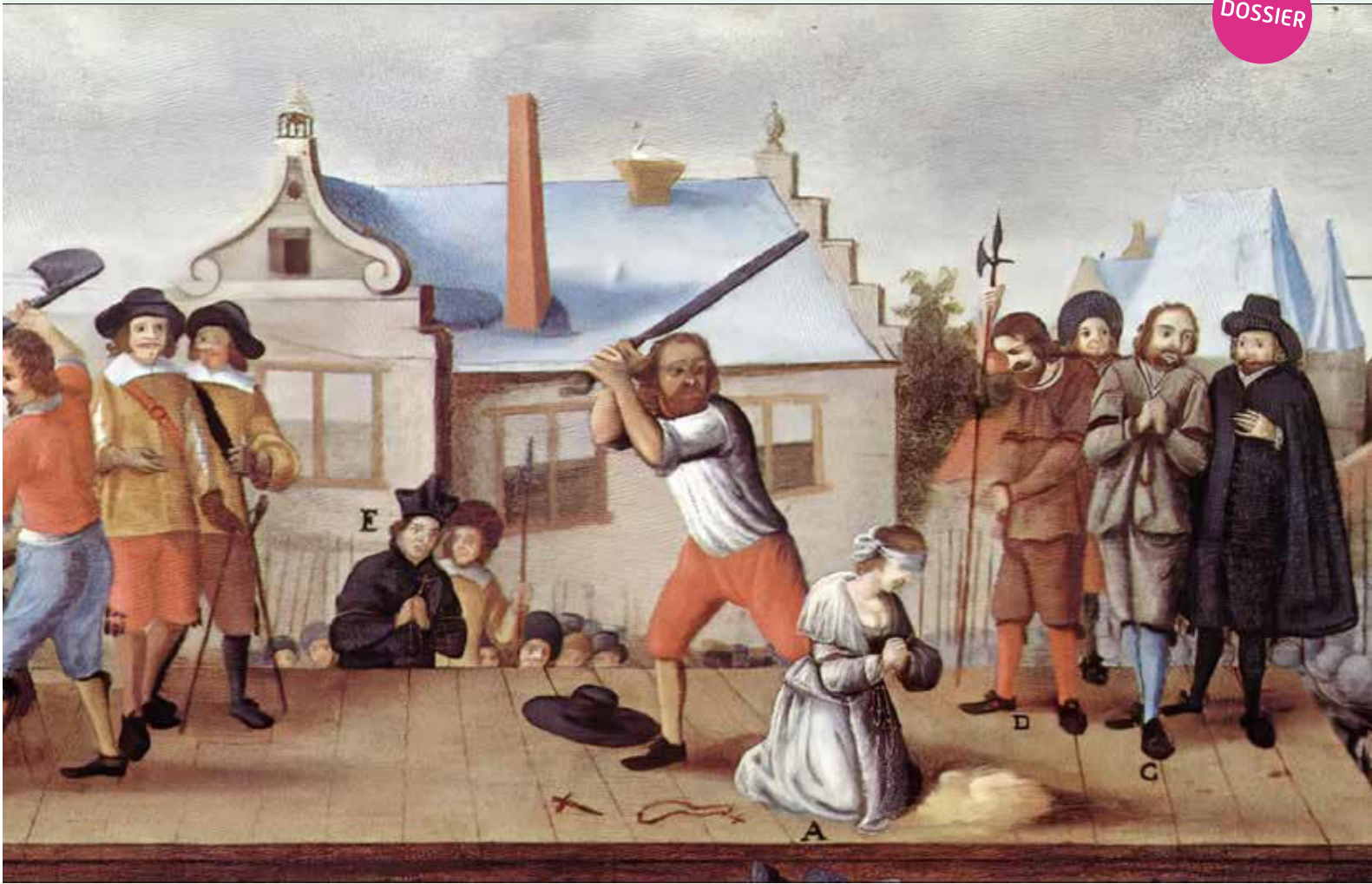
Detail uit: Terechtstelling van de beklagden van het Verraad van Maastricht in 1603 , 18de eeuw. Bonnefanten Maastricht, langdurig bruikleen LGOG

gratie verleend onder de voorwaarde dat hij voortaan de taken van beul op zich nam.