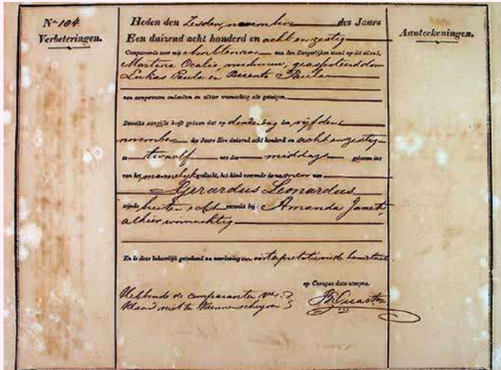
Het is handig om bij Curaçaose families ook te zoeken via de site van het Nationaal Archief in Willemstad.

B esef dat het moeilijk is in te schatten hoe ver terug je uiteindelijk zult komen. Het kan ontzettend tegenvallen als je door bronnengebrek al snel op een doodlopende weg zit.