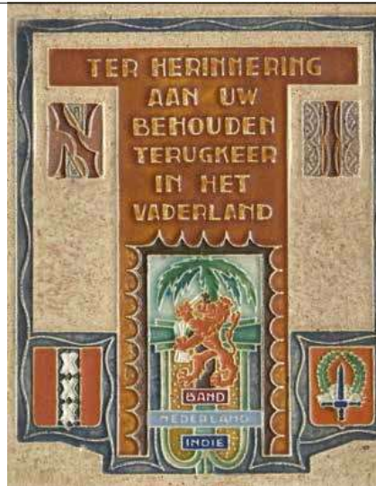
Herinneringstegel. Part. coll.