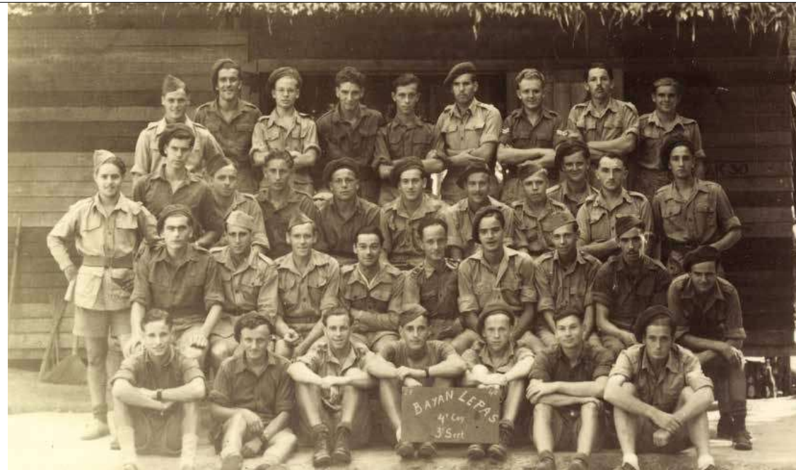
Evert-Jans groep van het Gezagsbataljon op Malakka, 1945.

Mijn opa zat bij de W-Brigade, zo was te lezen in de staat van dienst. 5 MP I was zijn onderdeel. Maar dan? Want het leger was doorspekt met afkortingen van bataljons en compagnies als 3-1 RI, 4 Inf XII KNIL of 2 INBAT. Het was dus eerst zaak om al die verschillende onderdelen te leren kennen. De website indie-1945-1950.nl was daarbij van grote waarde. Dat is een particuliere site die zich ten doel stelt een helder overzicht