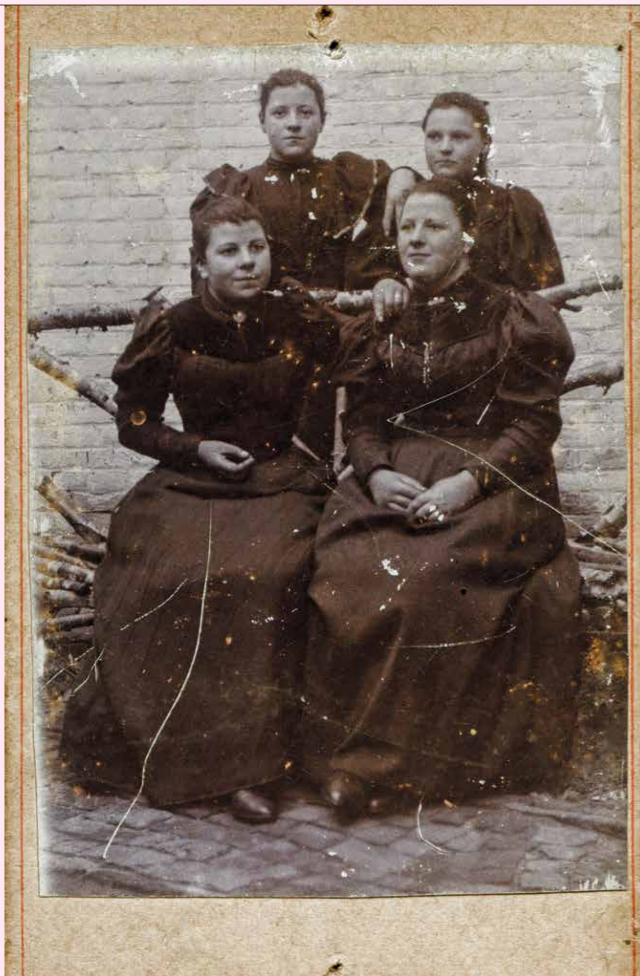
Carte-de-visite zonder opdruk. Part. coll.