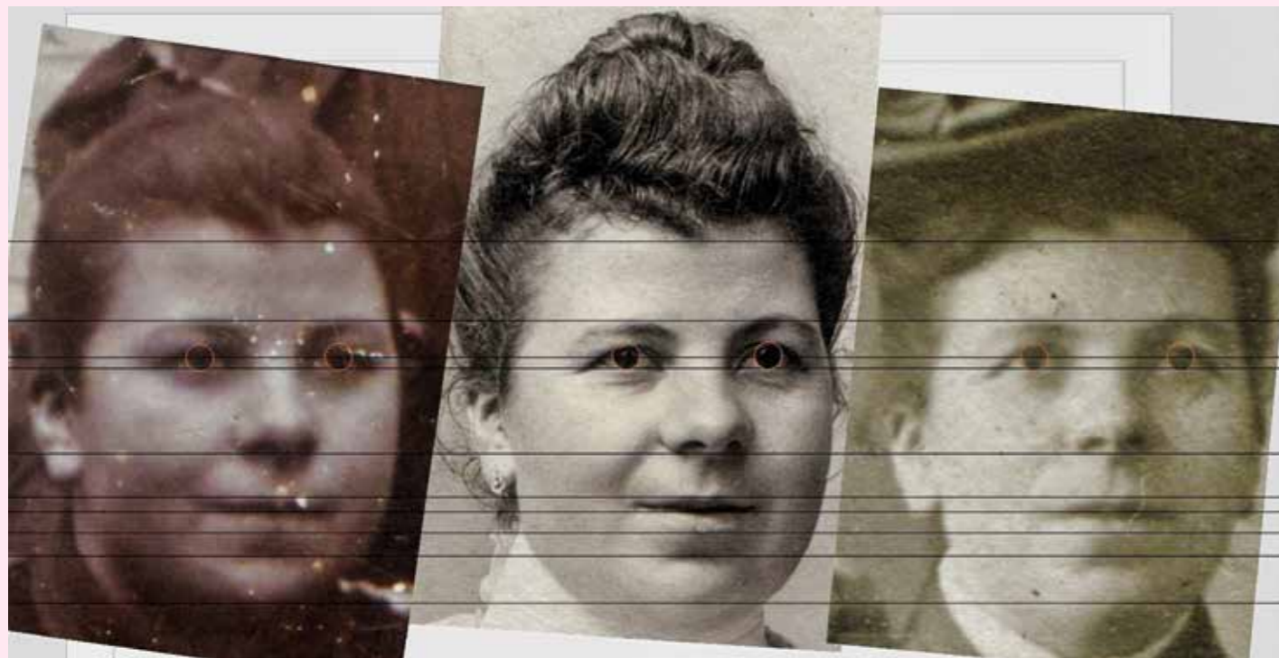
Met de grootte van de ogen als referentiepunt, lijken de gezichtsverhoudingen op de foto's overeen te komen.

Daarmee kunnen we deze foto dateren rond 1907-1910. De vrouw zou dan geboren zijn in de periode 1870-1875. De kinderen zijn dan respectievelijk geboren tussen 1897 en 1900 en 1899 en 1902.