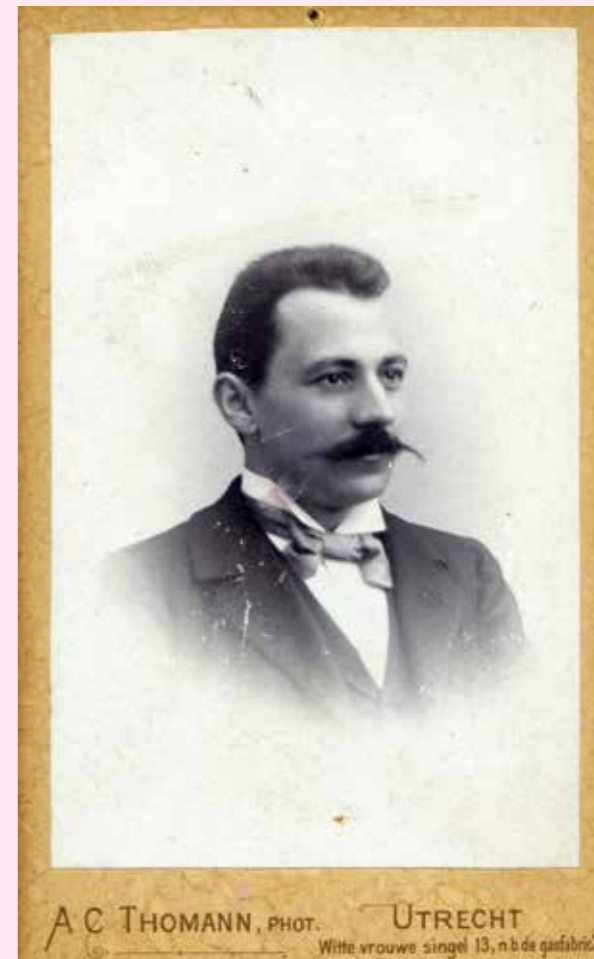
De man is naar schatting rond de dertig, dus geboren omstreeks 1870.

De zekerste vorm van controle is een foto van de kandidaten, dan kun je de gezichten vergelijken. Ga op zoek bij familie dichtbij en ver weg, want foto's werden meestal via de vrouwelijke lijn doorgegeven. Je kunt geluk hebben op de bekende grote genealogische websites, op RKD Images, lokale beeldbanken, of via Google op familiewebsites.