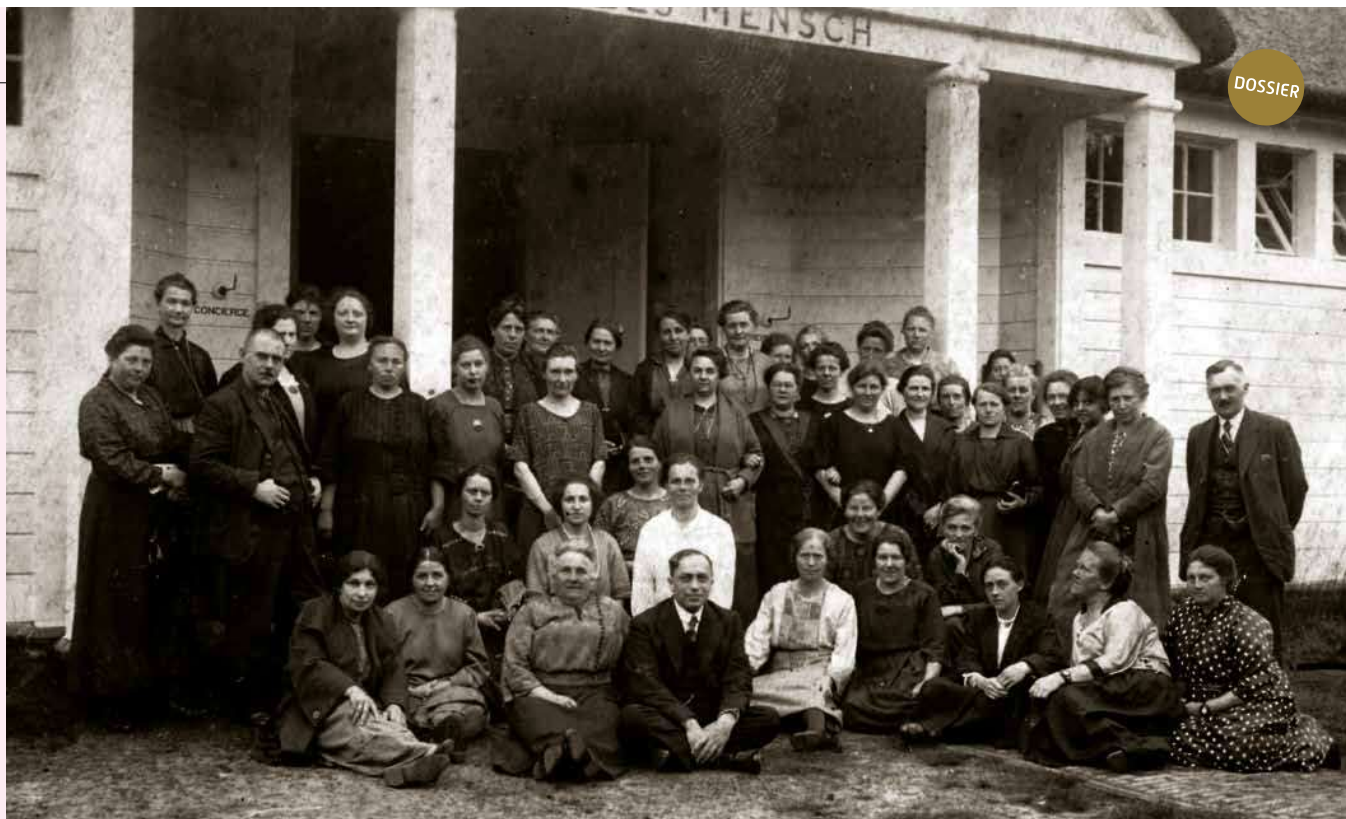
Eerste bijeenkomst van vrouwelijke SDAP-raadsleden, en enkele mannen, in 1924. Part. coll.

In 1919 kwamen de eerste vrouwen in de gemeenteraad. Het waren er bijna honderd. Allemaal gekozen door mannen, want zelf stemmen mochten vrouwen pas in 1922. Wie waren deze vrouwelijke pioniers? Portretten van een rood raadslid, een liberale wethouder en van een late pionier: de eerste vrouwelijke burgemeester in ons land. Auteur Jan de Roos