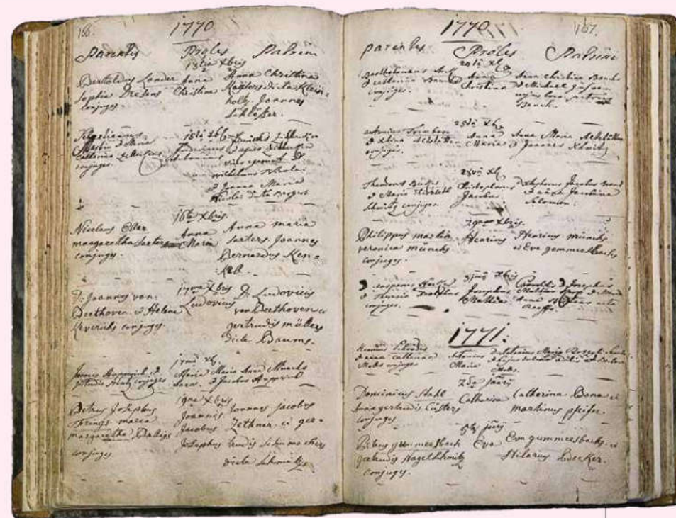
Doopinschrijving van Ludwig van Beethoven, 17 december 1770. Coll. Stadtarchiv Bonn

FamilySearch bevat miljarden digitale afbeeldingen en registers, zowel kerkelijk als burgerlijk. Deze site wordt ondersteund door de mormonen en is volledig gratis te gebruiken. Om alle functies van deze site te kunnen gebruiken, zoals het bekijken van afbeeldingen, moet je wel een account aanmaken. Dit brengt geen verplichtingen met zich mee. Om alle documenten van een bepaald rechtsgebied of bepaalde