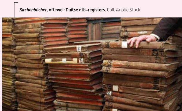
Kirchenbücher, oftewel: Duitse dtb-registers.

bestuurs eenheid in FamilySearch te vinden, log je in en volg je deze stappen: > FamilySearch.org > Onderaan de pagina kun je de taal instellen. Kies 'Nederlands' > Klik op 'Zoeken' en er verschijnt een menu > Klik op 'Catalogus' > Typ de plaatsnaam in het zoekvenster (FamilySearch houdt de plaatsnamen aan zoals ze staan in Meyer voor de periode 1871-1918) > Maak een keuze uit de lijst met soorten documenten. Om op een specifiek persoon te zoeken in FamilySearch, log je in en volg je deze stappen: > FamilySearch.org > Klik op 'Zoeken' en er verschijnt een menu > Klik op 'Documenten' > Typ een naam in het zoekvenster. Veel documenten zijn geïndexeerd en