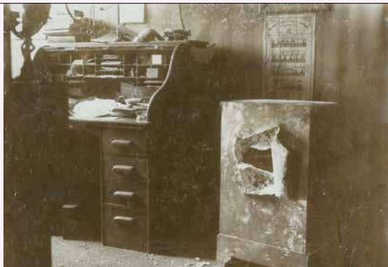
Foto van een gekraakte brandkast, gevoegd bij een dossier in het archief van het Gerechtshof in 's-Hertogenbosch.