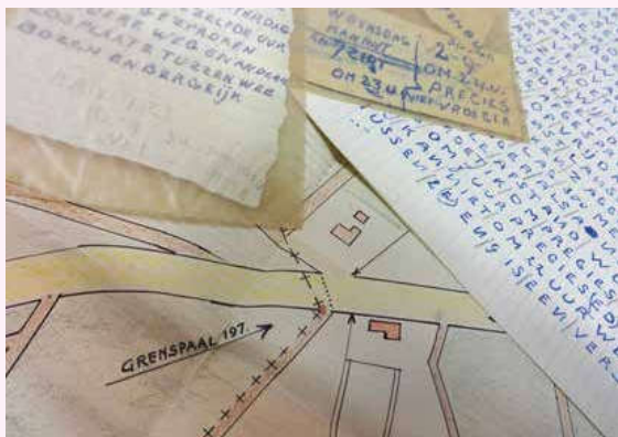
Kaart en briefjes gebruikt bij de smokkel van boter en vee, samen met een verklaring van de verdachte opgenomen in het archief van de arrondissementsrechtbank in 's-Hertogenbosch.

vinden in archieven van andere gemeentebesturen, maar ze zijn doorgaans niet digitaal op naam ontsloten. Geen grote series dus, maar losse dossiers als krenten in andere pap.