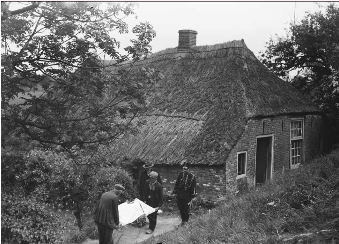
Een slachtoffer van de roofmoord op de gebroeders Verhoeven, in de nacht van 15 op 16 mei 1934, wordt weggedragen van de boerderij. De daders behoorden tot de 'Bende van Oss'.